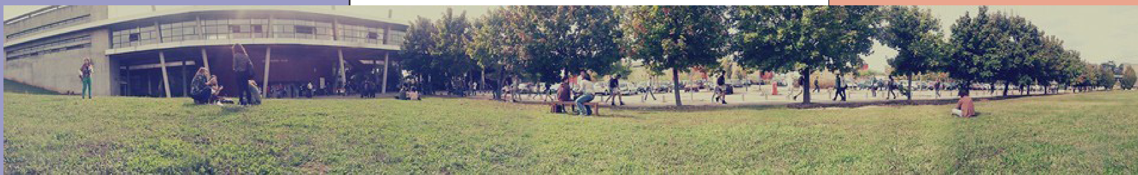
Foto 1: prédio da Universidade - Faculté de Géographie, Histoire, Histoire de l'Art et Tourisme