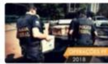
Fase 2 da Operação Panatenaico mira fraudes nas obras do BRT - Sul