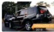
PF desarticula quadrilha de roubo de cargas no Rio e na Baixada Fluminense