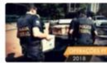
Fase 2 da Operação Panatenaico mira fraudes nas obras do BRT - Sul